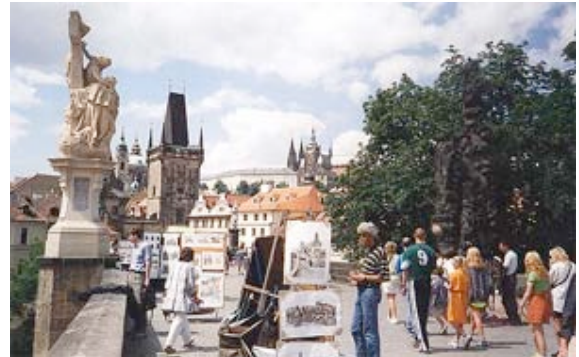
Image and Word in Central Europe is directed by the Czech Program of the University of Texas at Austin in cooperation with the Prague Film School (FAMU). The courses in film, art history, and architecture explore Prague's rich cultural history and its vibrant cultural present .